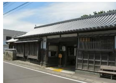
阿波十郎兵衛屋敷