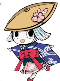
徳島市イメージアップキャラクター トクシィ