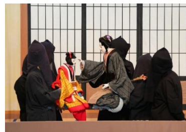
人形浄瑠璃「傾城阿波の鳴門」