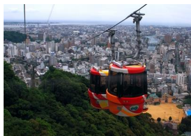
眉山ロープウェイ